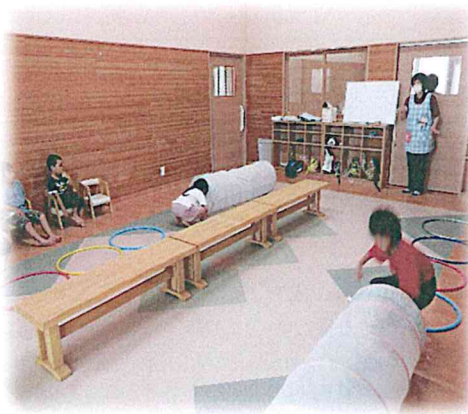
平均台の中央でお友達とじゃんけん、ポン!