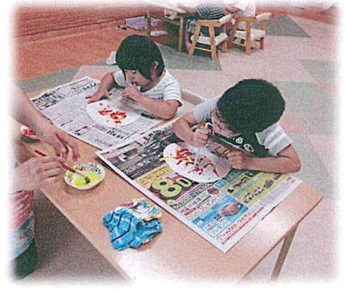
フーッと吹いて絵の具を広げます